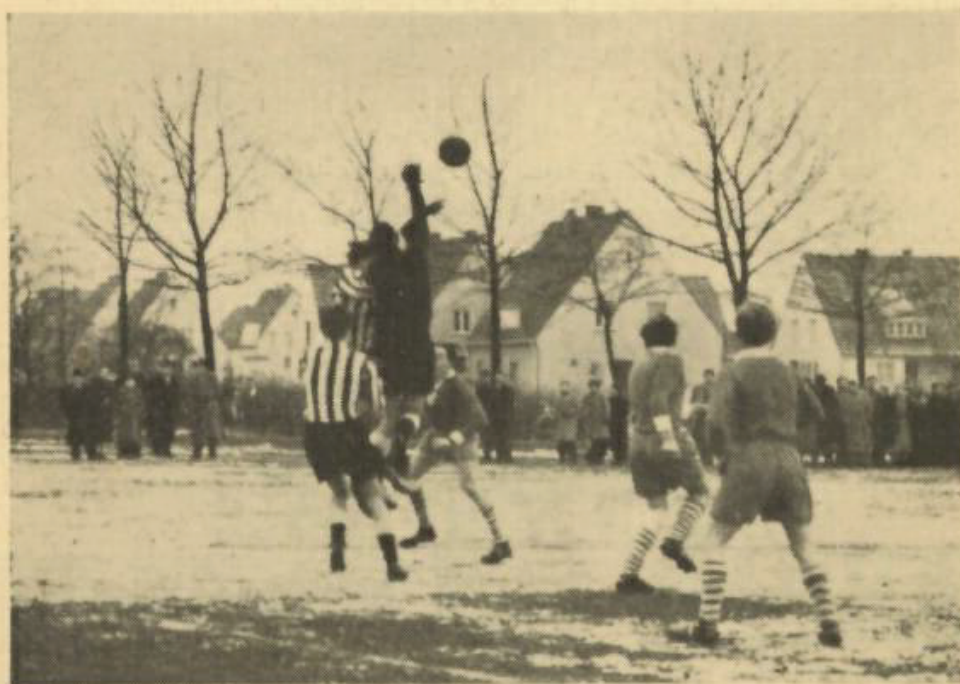
Trotz Eis und Schnee geht der Kampf um die Punkte weiter. Auch diesmal war die Vorwärts-Hintermannschaft nicht zu überwinden.