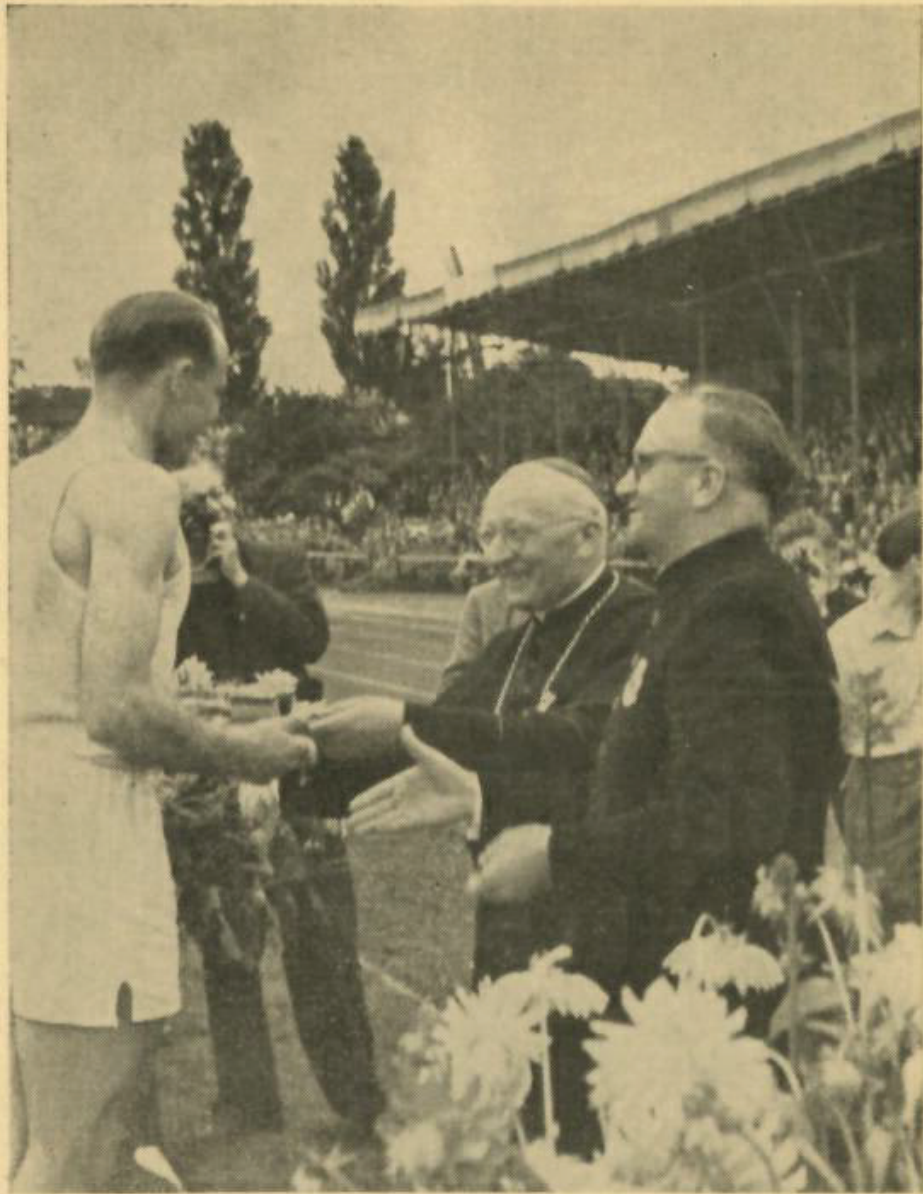
Der Erzbischof von Paderborn und Verbandspräses Kiwitt bei der Ehrung verdienter Sportler