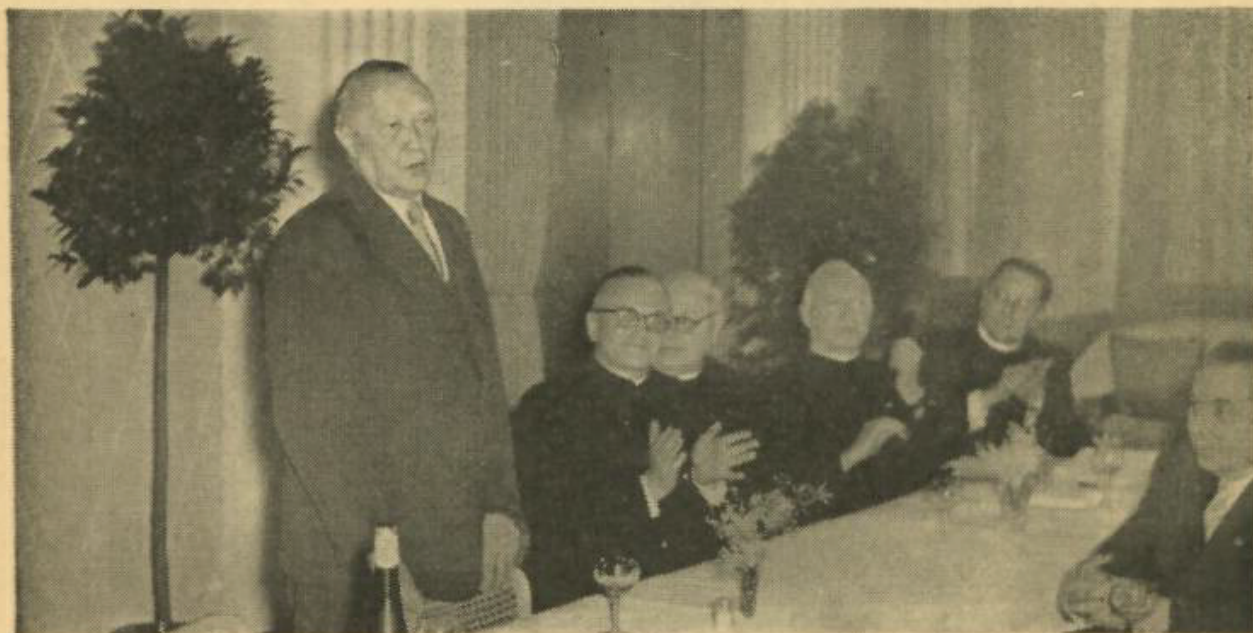
Der Bundeskanzler bei der DJK