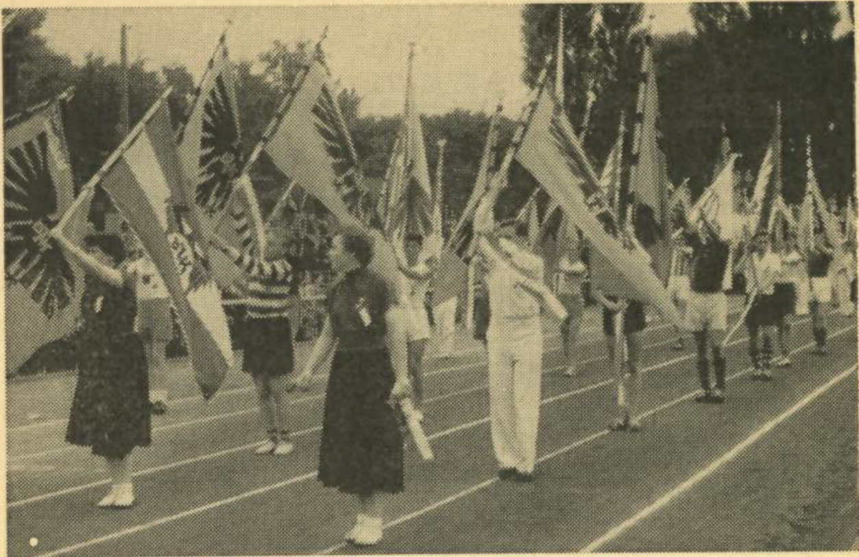
Einzug der Banner beim Verbandstreffen 1955

Nur aus dem harmonischen Dreiklang von Körper, Geist und Seele sind höchste Leistungen möglich. Darum bejahen wir freudig den Sport als Dienst am Menschen und als Bekenntnis zur Kraft, Anmut und Reinheit. Wir dienen unserem Gott, wenn wir die Würde des Menschen erhöhen helfen. Darum die Deutsche Jugendkraft!